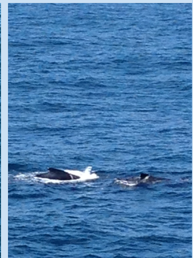
A turtle and two whales, mother and son, spotted while crossing the sea to go on board.